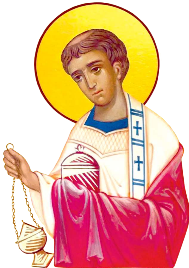
Архидиакон Стефан День памяти 27 декабря (9 января)

«В Рождество все немного волхвы...», эта такая знакомая строчка И. Бродского лучше всего передаёт настроение хрустально-сказочных Святочных дней. Пахнет хвоей и мандаринами, свежим снегом, конфетами и чистой радостью. Каждый спешит принести свой дар близким. Праздничным утром привычно открываем очередной листок толстого новенького календаря. 9 января. День памяти первомученика и архидиакона Стефана. Первого святого, отдавшего жизнь за Христа. И останавливаемся, нет, не для скорби и горевания, но для осмысления Рождества Христова, самого щедрого дара для заблудшего человечества. И подумаем о жизни по христианским законам. Кто же он такой, Стефан, окончивший свою земную жизнь почти две тысячи лет назад?