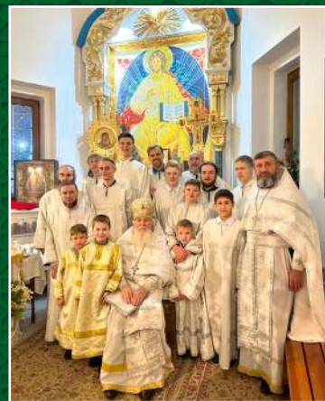
Праздничная Рождественская Литургия в Сергиево-Казанском храме р.п. Краснообск, январь 2025 г.