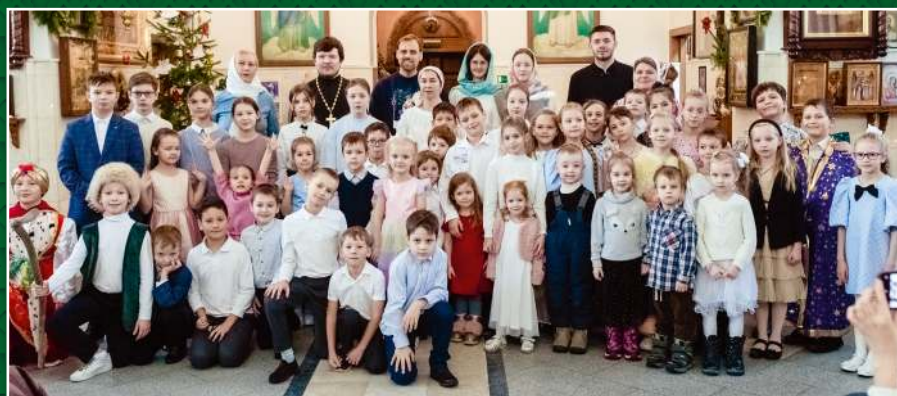
Праздник Рождества Христова в Воскресной школе р.п. Краснообск, 2025 г.