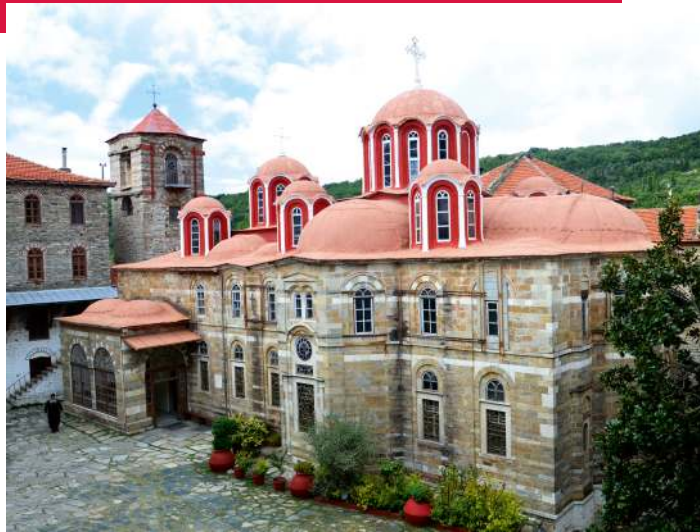
Констамонит (Костамонит) — православный греческий монастырь на Святой Горе Афон, освящён во имя Стефана Первомученика.