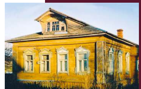
Больница, построенная Николаем Григорьевым для односельчан