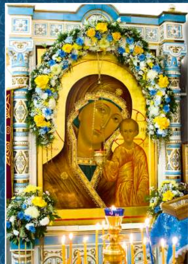
Престольные праздники Сергиево-Казанского храма р.п.Краснообск 18 июля – память прп. Сергия Радонежского, 21 июля – иконы Божией Матери «Казанская»