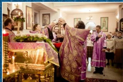
19 августа – Преображение Господа Бога нашего Иисуса Христа, 28 августа – Успение Пресвятой Богородицы, 27 сентября – Воздвижение Креста Господня