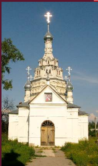
Восстановленный храм Св. Николая Чудотворца в Сергиевском