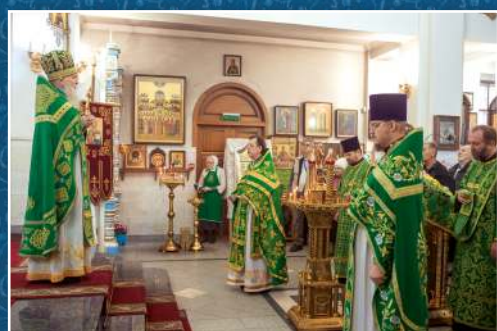
8 октября – память прп. Сергия Радонежского