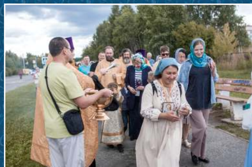
Крестный ход вокруг р.п.Краснообск