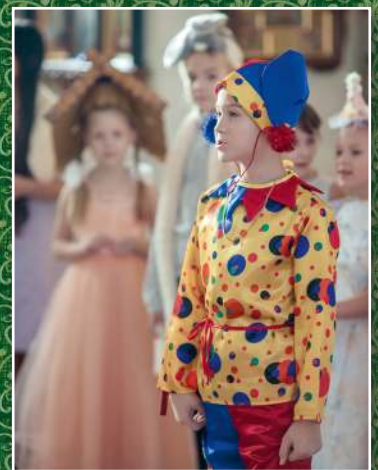
Праздник Рождества Христова в Воскресной школе п. Краснообск, 2024 г.