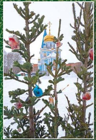
Подготовка к Рождеству Христову, Сергиево-Казанский храм, п. Краснообск, 2024 г.