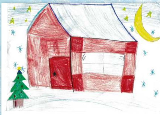
Настя, 5 лет