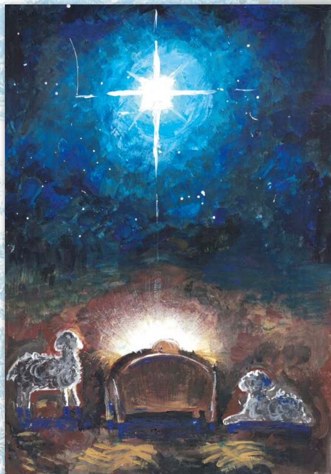
Таисия, 13 лет