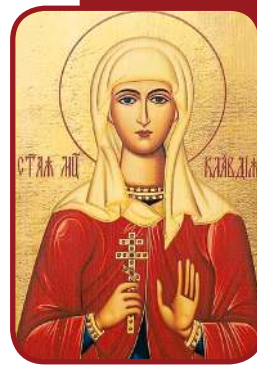
Мученица Клавдия Римская

После похорон святого мученика Филиппа Евгения, Клавдия, Прот и Иакинф вернулись в Рим и, поселившись в родовом имении, усердно предались посту и молитве. По прошествии некоторого времени святая Евгения получила письмо от знатной девушки по имени Василла, которую отец держал под замком из-за ее желания