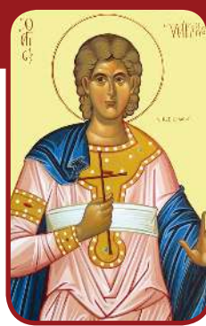
Мученик Иакинф Римский

сделаться христианкой. Василла получила от святой необходимые наставления в вере и была тайно крещена Римским епископом. Между ней и Евгенией завязалась дружба, ибо их объединяла любовь к святому девству. Вскоре одна из служанок Василлы выдала секрет госпожи некоему Помпею, желавшему на ней жениться. Последний, придя в ярость, добился от императора, врага христиан, того, что святая Василла была схвачена и обезглавлена.