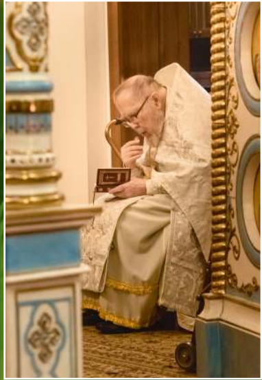
Праздничная Рождественская Литургия в Сергиево-Казанском храме р.п. Краснообск, 2022 г.