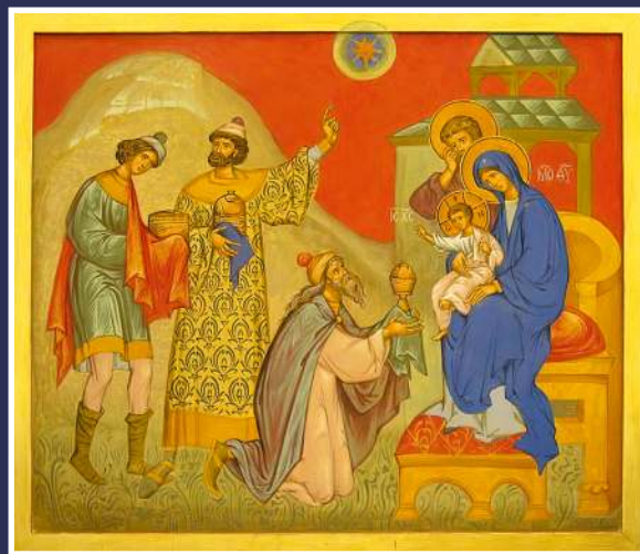
Поклонение волхвов. Современная икона.

Все дружно глянули на небо. Снег перестал, и, невзирая на городские огни, на небе проступили звёзды. Одна из них, ниже и крупнее других, заметно двигалась.