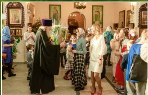
Праздник Рождества Христова в Воскресной школе р.п. Краснообск, 2022 г.