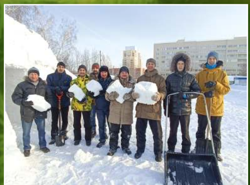
Строительство Рождественского вертепа, 2022 г.