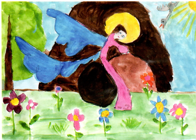
«Ангел на камне у Гроба Господня».

Здесь я занимаюсь с четырех лет. И в первый год нарисовала к Пасхе такую картинку: