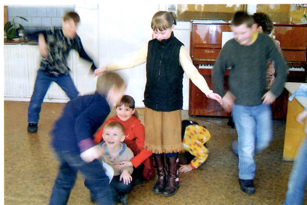
Идет репетиция спектакля