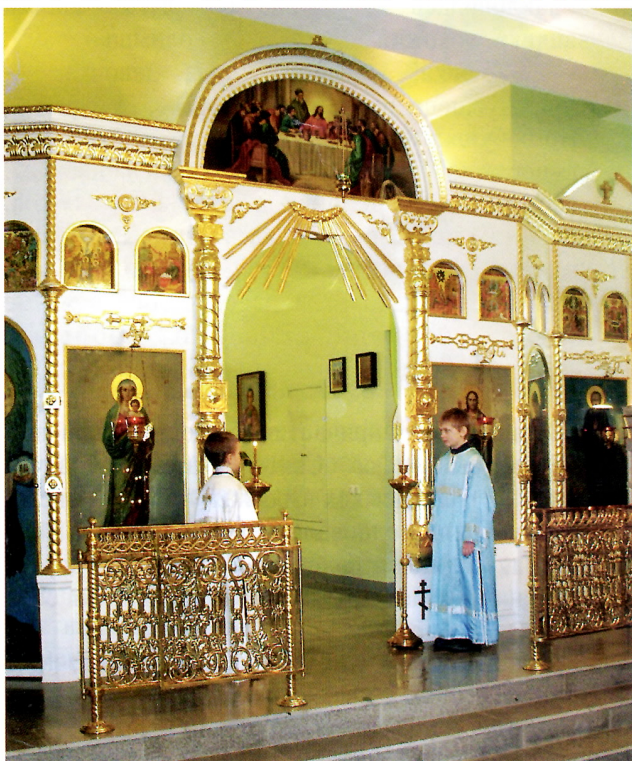
На Божественной литургии